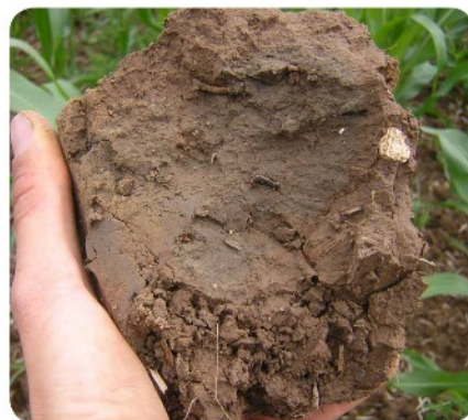
Een ongunstige bodemstructuur.