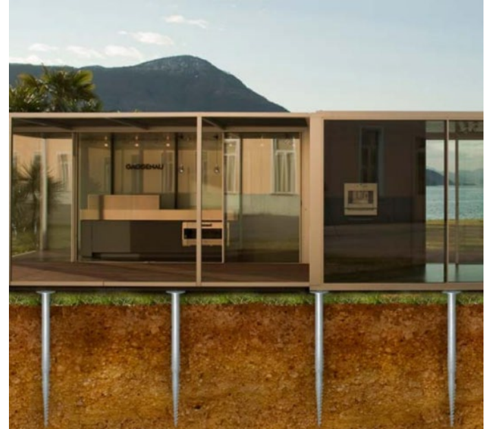
Krinner (grondschoef), Gaggenau exhibition space on Lago Maggiore (Switzerland)