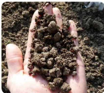
Kruimelstructuur in een bodem rijk aan organisch materiaal.